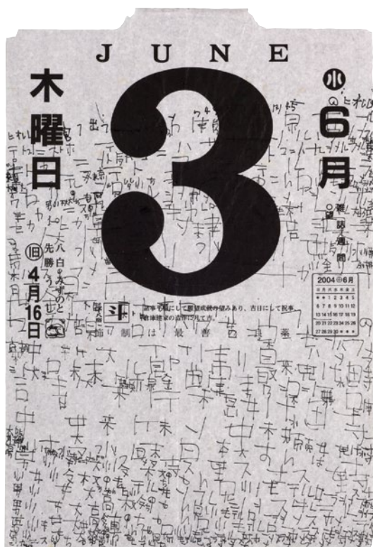
Kunizo Matsumoto, Sans titre (3 juin 2004), 2004, encre de Chine sur page de calendrier. Courtesy Galerie Christian Berst.

JE SUIS RASSURÉ DE RENCONTRER QUOTIDIENNEMENT UNE NOUVELLE GÉNÉRATION D'HISTORIENS DE L'ART, DE CURATEURS, DE CONSERVATEURS QUI VEULENT PRENDRE EN COMPTE L'ART BRUT DANS SA PARTICULARITÉ.